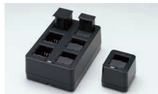
▲1.6スロットバッテリー充電器 ※別売の充電器にバッテリーは含まれません。