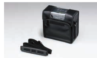
▲キャリーケース ▲ショルダーストラップ ※キャリーケースにはショルダーストラップが付属します。