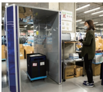
▲納品された商品は、箱に入ったままRFIDトンネル式ゲートを通すだけで検品が完了する