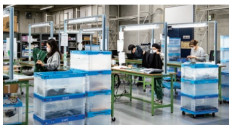
▲輸入商品は全品の品質チェックを行い、国内基準に合致した品質表示タグなどを縫い付けて出荷