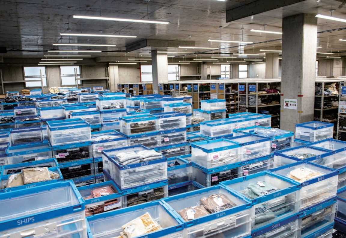
▲量み陳列する商品を中心に、約60万点の在庫を有するコントロールセンター。出荷の多い新しい商品はオリコンでストックし、時間の経過とともにロケーション管理された棚へ移動