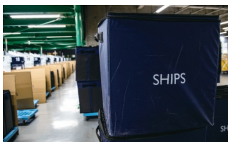
▲商品の運搬に使用するエコピズボックス。繰り返し使え、環境にも優しい