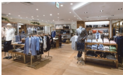
▲SHIPSアトレ恵比寿店(東京)。店舗はすべて直営で運営しており、商圏人口が多く、広域からも集客が見込める大都市の駅ビル等に多く出店