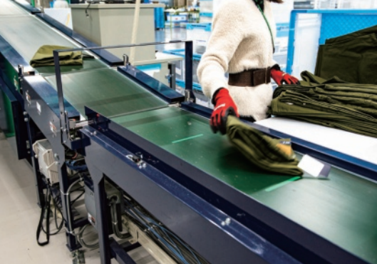
▲RFIDタグを読み取り、店舗ごとに商品を自動的に振り分けるソーター